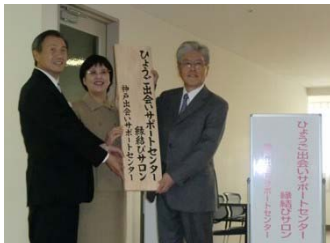
神戸出会いサポートセンター (Tel 078-381-6820)

12月1日、県内10か所に「地域出会いサポートセンター」が一斉オープンしました。今回、県及び兵庫県青少年本部では、個別にお見合い紹介を行う「はばたん会員」制度を新たに設け、各センターに配置された「このとり出会いサポーター」が会員登録の呼びかけや、希望者にはお見合いの調整、交際中のアドバイスなどを行います。詳細は最寄りの各センターまでお問合せください。