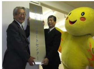
阪神南出会いサポートセンター (Tel 06-6481-7370)