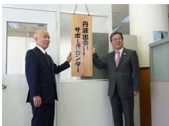
丹波出会いサポートセンター (Tel 0795-78-9130)