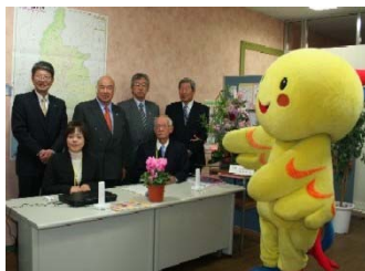
北播磨出会いサポートセンター (Tel 0795-38-8022)