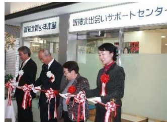
阪神北出会いサポートセンター (Tel 0797-26-7351)