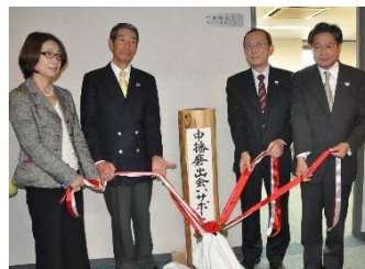
中播磨出会いサポートセンター (Tel 079-240-7005)