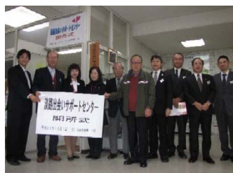
淡路出会いサポートセンター (Tel 0799-24-2717)