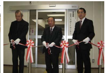
東播磨出会いサポートセンター (Tel 078-920-9337)