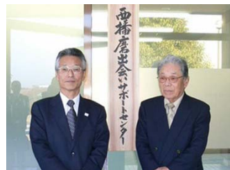
西播磨出会いサポートセンター (Tel 0791-58-1311)