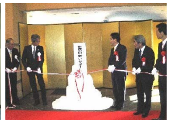
但馬出会いサポートセンター (Tel 079-662-7701)