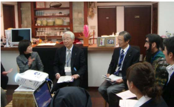
(問) 神戸県民局 078-382-8249

知事は「商店街の空き店舗を活用した『子育てほっとステーション』を開設し、そこを拠点に活動いただいている点がうれしい。この取組が他の成功事例になってほしい」と、今後の取組に期待を寄せました。