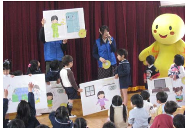
(問) 県環境政策課 078-362-9895

大型の紙芝居を使って水や電気等の大切さを知ってもらい、環境にやさしい生活を呼びかけました。また、環境を大切にすることをはばタンと約束することで、園児たちの環境への意識が高まりました。