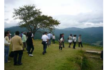
出会いイベント・ハイキング

当事業では、食事会やハイキングなど出会いのための多彩なイベントを開催しています。是非お申し込みください。