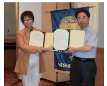
(問) 県少子対策課 078-362-4184