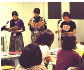
(問) 県少子対策課 078-362-4185