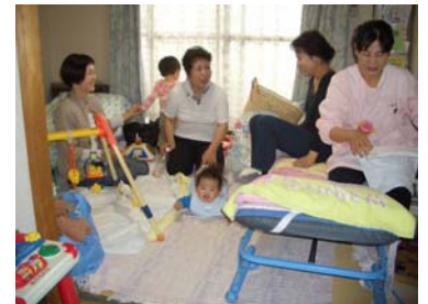
被災地からの電話相談を引受けた助産所「ほえむ」