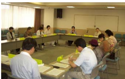
(問) 県少子対策課 078-362-4185

出席者からは、「私たち祖母世代がしっかりと子育て世代を応援しなければならない」と、改めて取り組みに向けた決意が語られました。