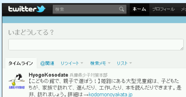
(問) 県少子対策課 078-362-4183