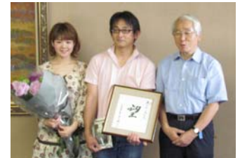
はばタン会員同士の初ゴールイン