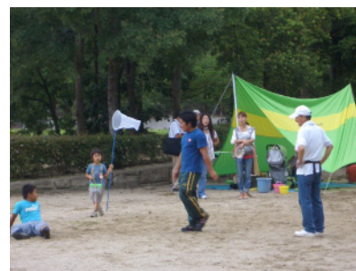
みんなでわんぱく in まるやま

平成19年からは、県の委託を受けて、灘区五毛の灘丸山公園で子どもの冒険ひろば「みんなでわんぱく」を開設しています。公園内の芝生や林、川や森などを使って、子どもたちの「やってみたい」を応援しています。