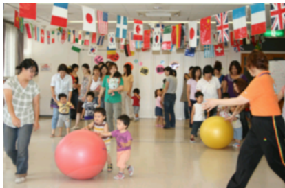
親子運動会の様子

生活協同組合コープこうべでは、子育てひろば、食育くらぶなどの立ち上げや運営支援を行う「コープ活動サポートセンター」を県内11か所に開設しています。