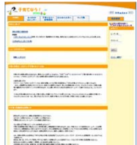
子育て支援ポータルサイト「子育てなう!」

ぜひ http://www.kosodate-now.jp/ までアクセスしてください!