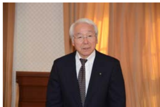
平成25年度予算案を発表する井戸知事