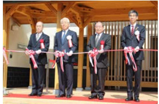
西宮子ども家庭センター竣工式の様子

これからも地元市町や関係機関と連携し、子どもや家庭に関する専門的な相談、支援に取り組みます。