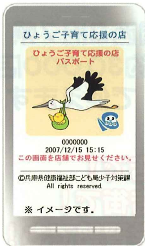
携帯電話パスポート画面イメージ